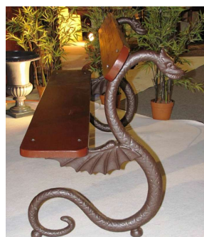
De bank die het Franse Fonderies Val de Saone nog kan leveren