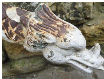
Een iets afwijkende kop