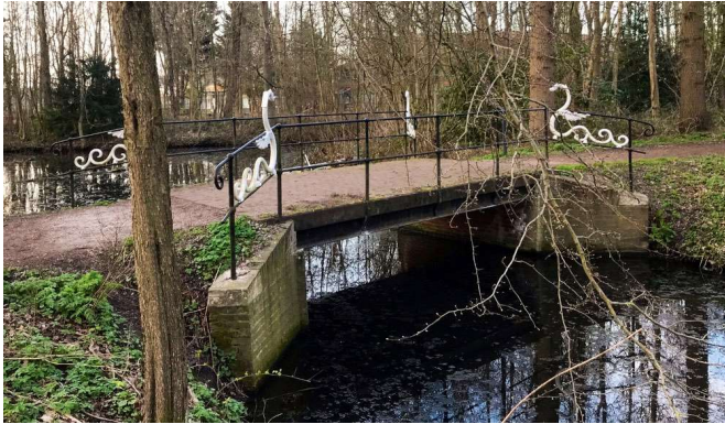
2022 – sinds 2001 zijn de dierfiguren onderdeel van de brugleuningen van de meer noordelijke brug (Jan Holwerda)