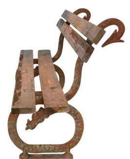
Een bank waar de linkerkop ook te zien is, met het pijlmotief (=de duivel), een slangdraak?