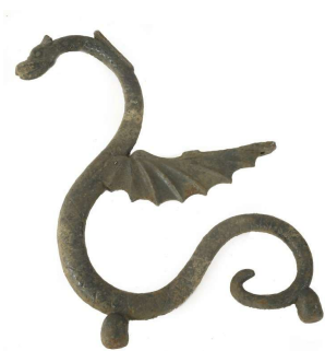
Exemplaar (veiling) uit de UK

Afsluitend is de conclusie dat de draakmotieven in de Drakenbrug van Rhijneest in oorsprong gietijzeren poten van tuinbanken zijn en dat deze uit de periode 1840-1870 dateren. Vermoedelijk zijn ze in de tweede helft van de 19 e eeuw op het centrale deel van de zuidelijke brug geplaatst, mogelijk met toevoeging van de extra staartkrullen en tezamen met de brugbalustrades op de zijdelen. Nu nog een catalogus vinden waarin de Rhijneester bankpootmotieven voorkomen.