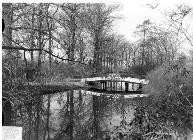
Eind 19 e eeuw - de brug met gietijzeren dierfiguren op het middendeel, met naar binnen gerichte koppen.

Het was een brug met vanaf de landzijden oplopende zijdelen naar een hoger geplaatst middendeel. De twee zijdelen kenden aan weerszijden gietijzeren balustrades. Hierbij waren tussen twee sokkelmotieven horizontaal vier rijen van zeven smalle liggende rechthoeken aangebracht, deze waren om en om open-gesloten. De balustrades van het hogere middendeel van de brug bestonden uit twee maal twee gietijzeren dierfiguren. Op de eerste foto uit vermoedelijk eind 19 e eeuw staan deze met de koppen naar elkaar gericht.