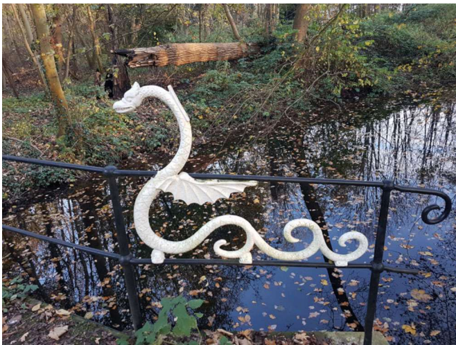
Is het een zwaan? Een slang? Een draak?

Een lijf als van een slang met vleugels en een al dan niet vuurspuwende kop is één van de associaties. Gezien de kam op de kop kan het ook een slangdraak zijn. Dan is er nog de Wyvern. Anders dan de Europese draak heeft deze twee poten, een kronkelende staart met schubben, een hanenkop, vleugels en een slangentong. Tot slot is er de Chimaera of Chimeer, een schepsel samengesteld uit delen van meerdere beesten. En daarmee kan je dus alle kanten op.