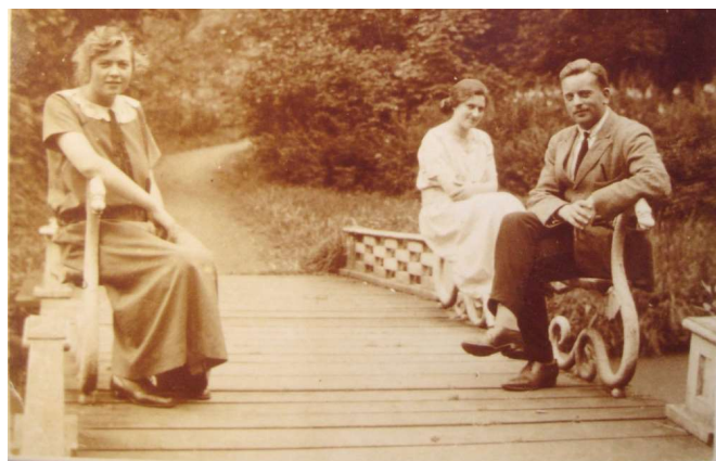
1925 – foto met de brug met naar de landzijden gerichte koppen met op de vleugel een plank tot zitplaats.

Een foto uit 1925 laat dezelfde opstelling zien en zichtbaar is dat op de vleugel van de dierfiguren een zitplank bevestigd is. (5) De brug kende daarmee een viertal zitplaatsen. Na WO II viel de brug ten prooi aan vandalisme en in de zestiger jaren van de 20 e eeuw werd de brug afgebroken. De dierfiguren verdwenen in opslag. Tot 2001, toen gingen de dierfiguren onderdeel uitmaken van de brugbalustrades van het eerdergenoemde noordelijke bruggetje. Ze zijn toen opgenomen en bevestigd tussen de horizontale ijzeren spijlen van die brug.