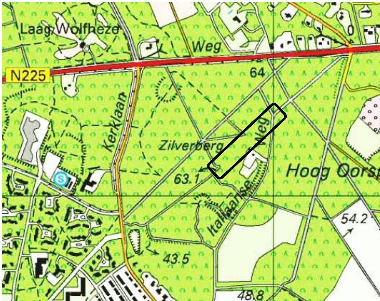
Afbeelding: uitsnede Topografische kaart, ca. 2000. Binnen het zwarte rechthoekige kader de locatie van de drie voormalige rondeltjes, ten noordoosten van Doorwerth en ten noorden van Italiaanseweg 1 te Doorwerth (watwaswaar.nl).