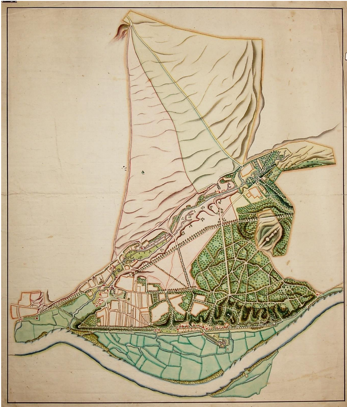
Afbeelding: De in het voorjaar van 2012 door Geldersch Landschap en Kasteelen aangekochte manuscriptkaart van de Heerlijkheid Doorwerth, ongedateerd (eind 18de eeuw), ongesigneerd.