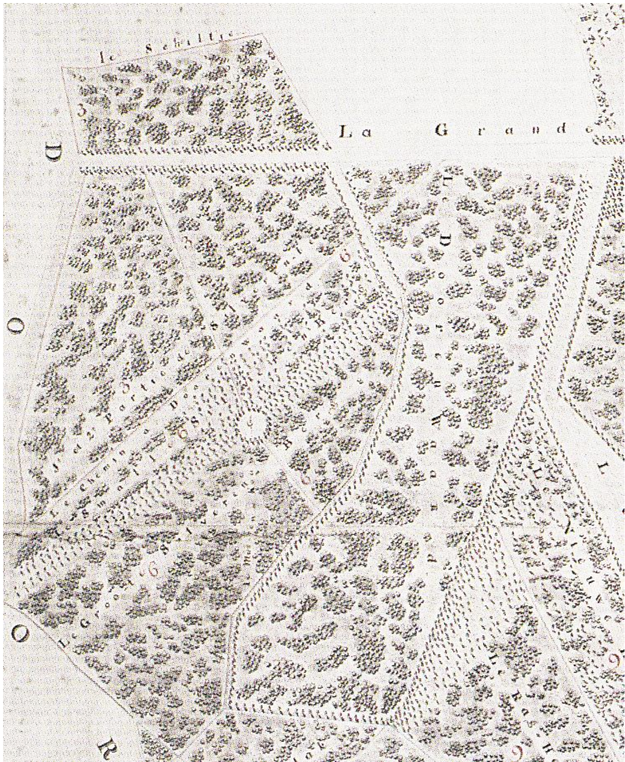
Afbeelding: uitsnede Plan figuratif du Bois impérial d'Oosterbeek, G.J. Dibbets, 1812 (NA VTH 1881). Ook op deze kaart is een laan over de Silberberg lopend te vinden. Het rondel op de Silberberg komt duidelijk naar voren, beide anderen worden niet weergegeven of bestaan niet meer (na de kap in 1804).