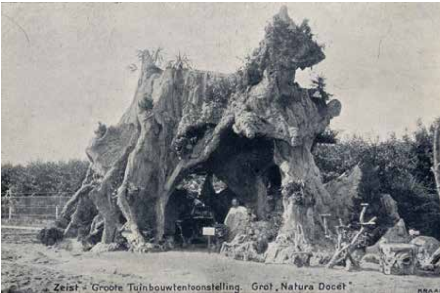
De grot 'Natura Docet' op de Grote Tuinbouwtentoonstelling te Zeist, 1909.

eenen mozaïken vloer; de grot zelf is zamengesteld uit zeer groote en kostbare stukken van verschillenden steen, van wijd en zijd bijeengebragt, als kompen van goud- en zilver-erts, graniet, bazalt, zoogenaamden bloedsteen, enz.' (1835). 'De groote steenen, die bij dezen waterval zijn aangebragt, zijn met buitengewone moeite en kosten van verschillende deelen des rijks aangevoerd; de grootste werden op de Veluwe gevonden. Moeijelijk zou men kunnen gelooven, dat Gelderland zulke zware granietblokken kan opleveren. Thans hier opeengestapeld en in sierlijke wanorde verspreid, toonen zij aan wat de wil van iemand, die voor geen moeite of kosten behoeft terug te deinzen, kan tot stand brengen; rotsblokken, die eeuw aan eeuw op dezelfde plek in den grond bedolven lagen en meestal slechts door een boven het heideveld uitstekend gedeelte van hun aanzijn deden blijken, zijn opgenomen en verplaatst naar een lustverblijf, waar zij door velen, die nimmer heuvelen of bergen en dus nog veel minder rotsen zagen, met verbazing worden aangestaard' is de lyrische aanvulling in Voormaals en heden: album van Arnhem's omstreken (1859).