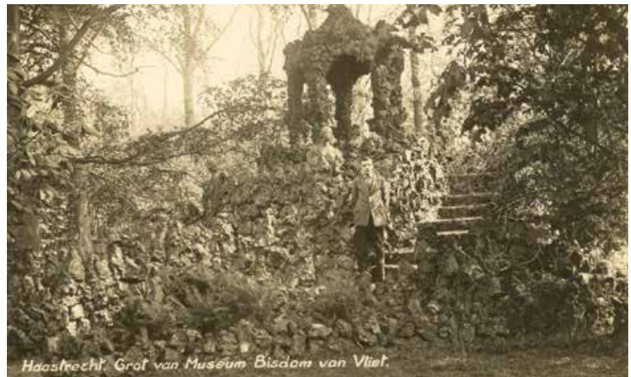
De grot in de Overtuin Bisdom van Vliet te Haastrecht.