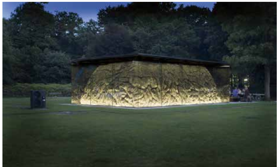
Het exterieur van de Grotto bij nacht, in de Oude Warande te Tilburg

H. M.J. Tromp, De Nederlandse landschapsstijl in de achttiende eeuw , 2012