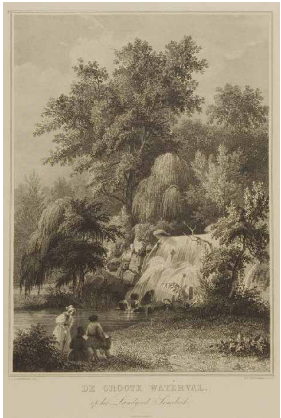
De groote waterval op het landgoed Sonsbeek, 1837, A.J. Couwenberg en H.W. Couwenberg. Coll. Gelders Archief.

Niet ver van Lichtenbeek liggen het al genoemde Sonsbeek en Rosendael. De voorgaande bijdrage eindigde met een citaat uit 1799 dat betrekking had op kasteel Rosendael met grotwerk van veel ouder datum. Het boekje Het reisje naar Gelderland (1830) brengt de beleving fraai in beeld: de hoofdpersonen van het boek hadden 'de kunstige, in den ouden smaak aangelegde grot en waterwerken beschouwd'. De een vond het 'stijf' en 'mishaagde de ouderwetsche deftigheid en ... al den rijkdom daaraan ten koste gelegd'. Een ander moest 'openhartig bekennen dat het haar weldeed, bij elke nieuwe lente, deze gedenkstukken der verledenheid, hoezeer dan ook van echten smaak ontbloot, telkens geeerbiedigd weder te vinden.' Ook het enige jaren eerder totaal herschapen Sonsbeek werd bezocht. De waardering voor de aanleg in de 'nieuwe smaak' spat eraf: 'Verrassend is er iedere voetstap. Rijkdom, pracht, netheid, orde heerscht er alom. Een edele, grootsche smaak straalt overal door. ... Ginds ploft een groote waterval met vollen spiegel neder; daar schuimt en bruist er een nog grootere over ontzaggelijke mas-