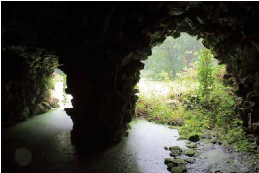
Zicht vanuit een van de grotten in het park van Kasteel van Attre. Denkbaar een blik die ook vanuit de 'grotten of souterrains' van Lichtenbeek bij Arnhem moet hebben bestaan.

Cats en H. Schwegman, met een gezicht over de vijver en in de verte het huis van Elswout, laat de ingang van deze spelonk zien die met een pontje kon worden bereikt.