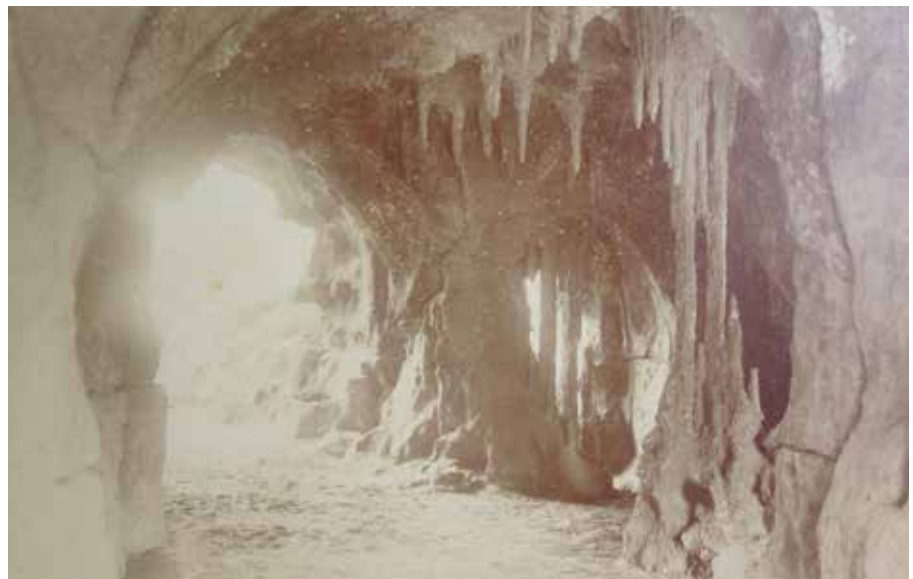
De grottunnel met stalactieten op Hydepark tussen Doorn en Driebergen, 1899.

Het genoemde cement werd vervolgens al snel, met bijvoorbeeld kippen-gaas als drager of wapening, toegepast voor de bouw van allerlei rustieke werken als tuinpaviljoentjes, bruggen, hekken, leuning, pergola's, bankjes, en grotten. Allen met een geboetseerde rustieke ruwhouten uitstraling of, bij grotten, als natuurgelijke rotsblokken. De uitstraling en het gebruikte materiaal leidden tot de meer recente stijlbenaming: cementrustiek. Hydepark, tussen Doorn en Driebergen, had veel en heeft nog steeds een aantal cementrustieke objecten. Tussen 1885 en 1889 verrees een immense villa en werd een groots park aangelegd. Dit park werd doorsneden door de Oude Arnhemse Bovenweg. Ter overbrugging werden een cementrustieke brug en een tweetal grottunnels gebouwd. Een van de grottunnels vormde en vormt nog steeds het hoogtepunt van de cementrustieke bouwwerken. In eerste instantie kende deze grottunnel zelfs stalactieten. Helaas zijn ze afgekapt nadat tijdens een passage van mevrouw