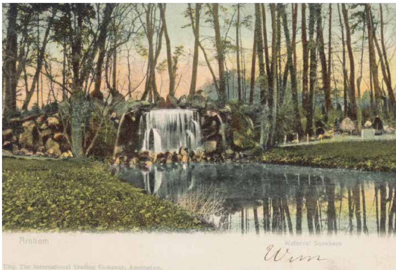
De waterval van Sonsbeek met de erachter gelegen grot, 1904.

In de voorgaande bijdrage werd aangegeven dat grotten al eeuwenlang deel uitmaken van onze tuinkunst en ook van onze buitenplaatsen. De schelpengalerij of -grot van Kasteel Rosendaal (Rozendaal) en de grot van Sonsbeek (Arnhem) werden genoemd als twee voorbeelden die mogelijk direct te binnen schieten. Na in te zijn gegaan op de verschillende invullingen van 'grotwerk' tot eind achttiende eeuw, nu een vervolgverhaal met beeldende contemporaine citaten die betrekking hebben op vormgeving, aankleding en beleving.