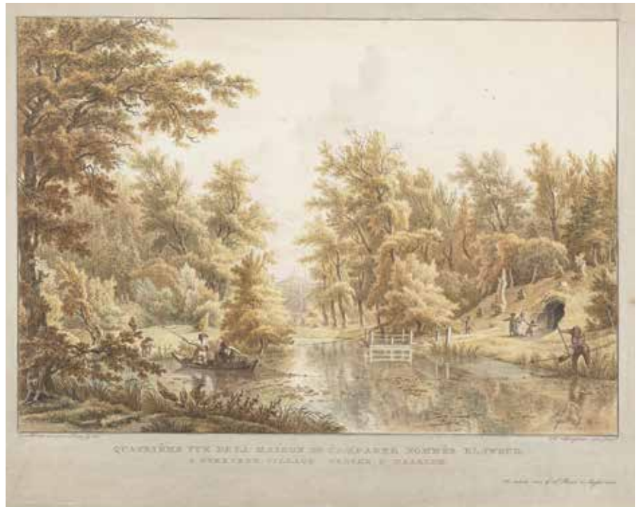
Gezicht over de vijver op, in de achtergrond, het huis van Elswout bij Overveen. Via een pontje was de 'Bosch-spelonk' aan de westzijde van de vijver bereikbaar. Door E. van Drielst, J. Cats en H. Schwegman. Coll. Noord-Hollands Archief.

In de tweede helft en met name het laatste kwart van de achttiende eeuw brak een nieuwe smaak in de tuinkunst door, die van de landschapsstijl. De toelichting van Hermannus Numan op de printtekening met 'couleuren' van Elswout bij Overveen kan gezien worden als een nadere uitwerking: 'veranderden de stijve regte laanen in aangenaam kronkelende en met beekjens doorsnedene, Wandelwegen ; eene groote verscheidenheid van boomgewassen verving de eentoonige menigte van Elsenhout, het oude Gothische Woonhuis veranderde in een modern Paleis, een schilderachtige Zwitsersche Brug, tusschen natuurlijke heuvelen; een wilde Bosch-spelonk en Arcadische Goden-Tempel, namen de plaats der Vijvers en Waterwerken in : in één woord, het verblijf der gedwonge Kunst werdt eene onbegrensde woning der vrije en verrukkende Natuur (1793). Over die 'Bosch-spelonk' is verder eigenlijk niets bekend, maar een prachtige topografische prent van E. van Drielst, J.